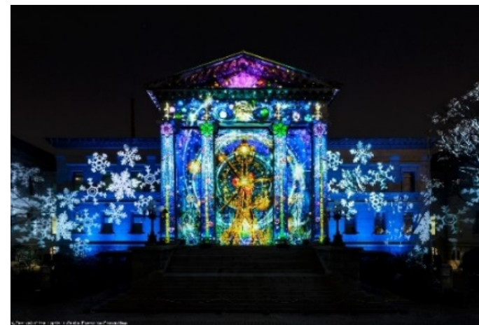
△OSAKA光のルネサンス「ウォールタペストリー特別公演」 2015年実施写真