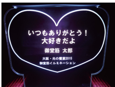
ハートデザイン版